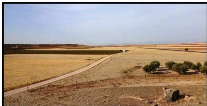
Camino de El Toboso a Alcázar de San Juan

Don Quijote y Sancho Panza han llegado a su pueblo por el mismo camino por el que salieron, por el camino de El Toboso, pero no han visto a Dulcinea en él. El camino de El Toboso al lugar de don Quijote, tiene, según nos describe Cervantes, una cuesta casi al llegar a él, que oculta su visión y desde la que, una vez en su cresta, se contempla el pueblo. ¿Estamos ante un recurso literario, como muchos defienden? ¿Existe realmente esta cuesta en el camino de El Toboso a Alcázar de San Juan? Solo hay que comprobar in situ esta parte del texto.