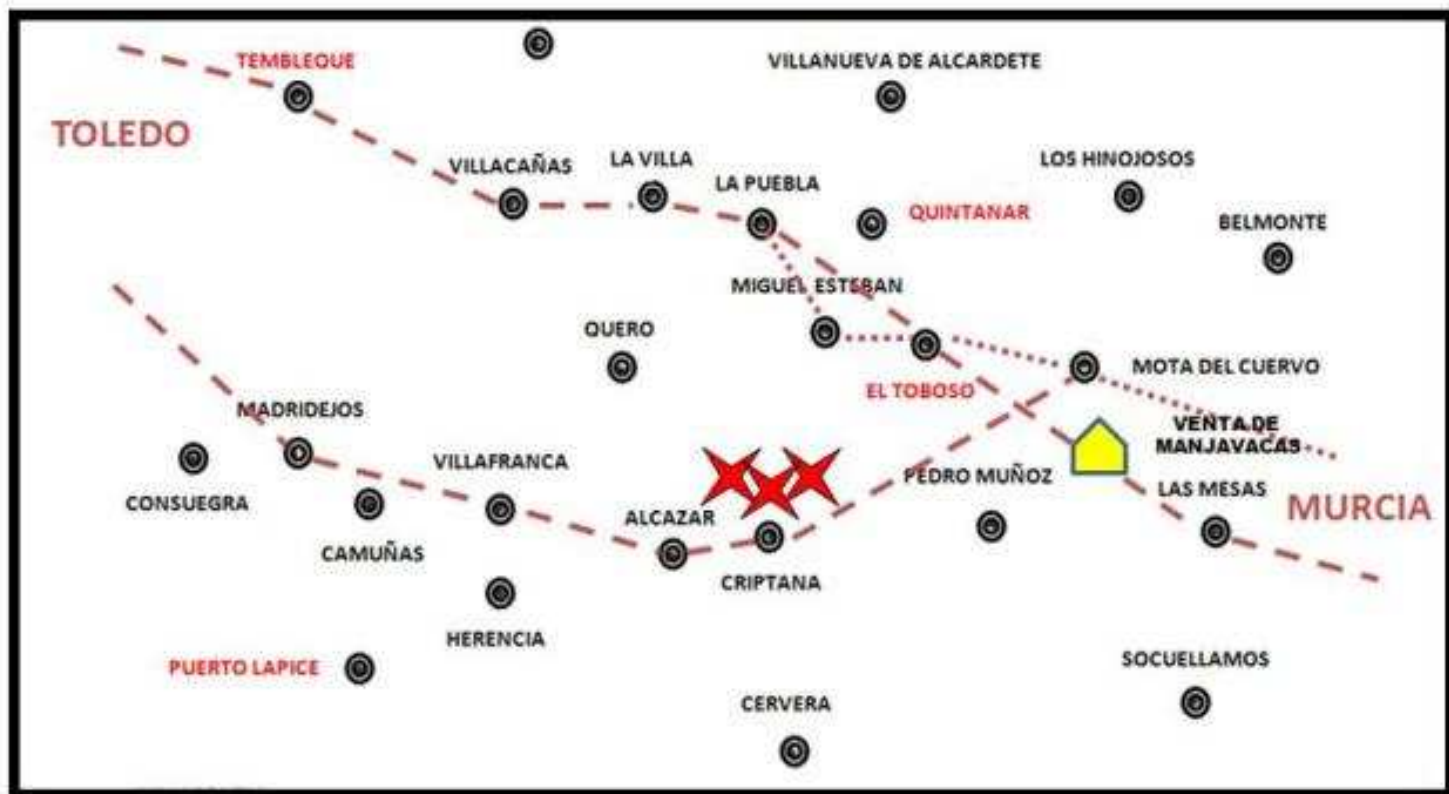
Plano con los caminos de Toledo a Murcia usados por los viajeros en el siglo XVI-XVII.

El Quijote , nuestro gran cuento de humanidades creado por Miguel de Cervantes, tiene como origen el pueblo de don Quijote y Sancho. Es, en la imagen ambiental del espacio manchego que nos transmite Cervantes, su principal nodo, desde el que los encamina en busca de aventuras, y a él siempre regresan. Don Quijote, en solitario, en la primera salida y acompañado ya de Sancho en la segunda, sale de su pueblo por un camino hacia el este. Solo hay que observar, en la primera salida, que regresando a casa desde la venta donde es armado caballero, don Quijote, se encuentra de frente en el camino, con unos mercaderes toledanos que iban a comprar seda a Murcia .