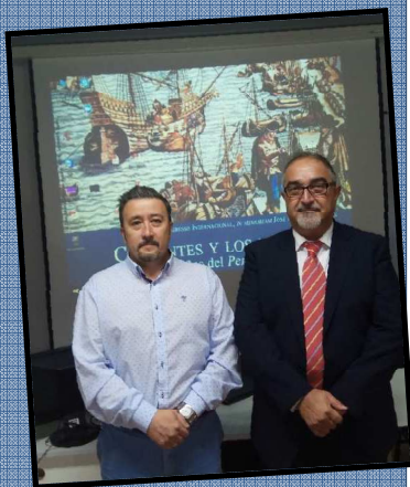
Miembros de la Sociedad cervantina, ponentes en el Congreso de Lisboa