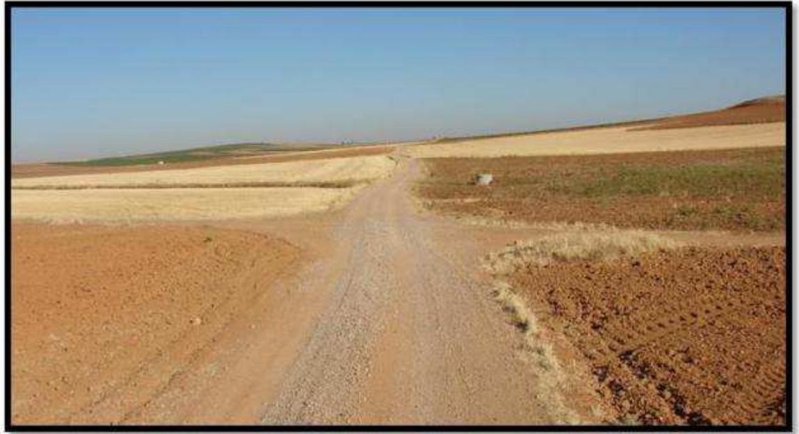
Cruce de las variantes del camino de Toledo a Murcia. Aquí dejó las riendas don Quijote a Rocinante.

Y es por ese mismo camino y dirección hacia el este, ya con Sancho, el que toman de nuevo en la segunda salida de su pueblo: acertó don Quijote a tomar la misma derrota y camino que el que él había tomado en su primer viaje . Salen, a escondidas, en mitad de una noche calurosa de verano manchego, y al poco de amanecer, descubrieron treinta o cuarenta molinos de viento que hay en aquel campo . Que estos molinos de viento son los de Campo de Criptana, hoy ya no le cabe duda a nadie por ser esta villa manchega la única que disponía de tantos molinos de viento antes de la escritura de la primera parte del Quijote .