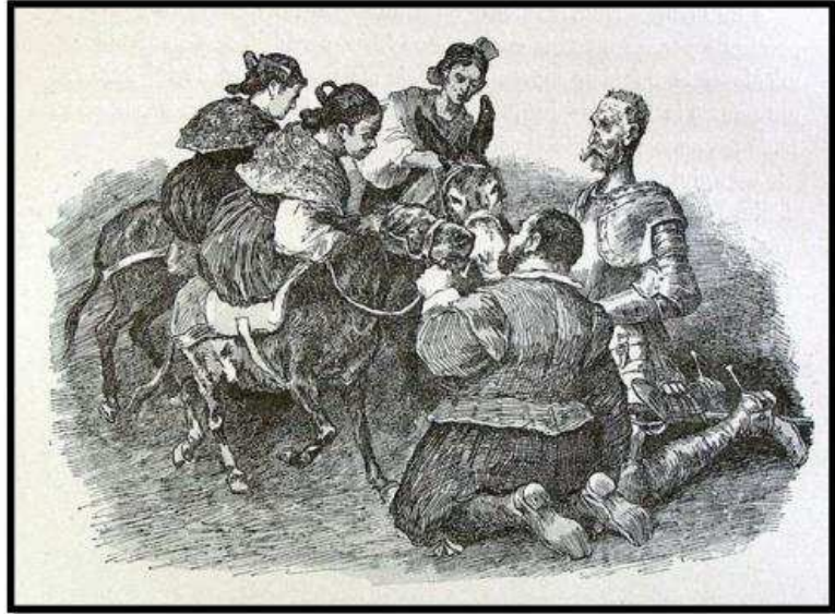
Don Quijote ante una aldeana toboseña encantada por Sancho en Dulcinea.

En las afueras de El Toboso conoció don Quijote a su princesa Dulcinea, pero encantada en una labradora. Y desencantada la quiere ver a su regreso de Barcelona, después de que Sancho hubiese cumplido con la penitencia impuesta por el mago Merlín: que para recobrar su estado primo la sin par Dulcinea del Toboso, es menester que Sancho... se dé tres mil azotes y trescientos en ambas sus valientes posaderas, al aire descubiertas, y de modo que le escuezan, le amarguen y le enfaden. Don Quijote volvía a casa derrotado en las playas de Barcelona por el Caballero de la Blanca Luna, Sansón Carrasco disfrazado, y lo hace por El Toboso, con el deseo de ver a su Dulcinea desencantada en ese mismo camino. Sancho había terminado su fingida penitencia después del encuentro con don Alvaro Tarfe, y don Quijote esperaba, de un momento a otro, encontrarse con Dulcinea desencantada en el camino. Pero llega a ver su pueblo sin verla: siguiendo su camino, no topaba mujer alguna que no iba a reconocer si era Dulcinea del Toboso... Con estos pensamientos y deseos subieron una cuesta arriba, desde la cual descubrieron su aldea, la cual vista de Sancho, se hincó de rodillas, y dijo: Abre los ojos, deseada patria, y mira que vuelve a ti Sancho Panza tu hijo, si no muy rico, muy bien azotado.