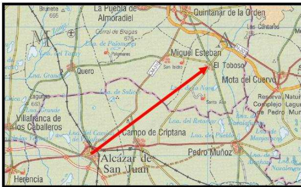
3ª salida hacia El Toboso

Sin embargo, en la tercera salida de su casa no siguen este mismo camino y dirección. Esta vez don Quijote quiere ir hacia Zaragoza, pero antes quiere pasar por El Toboso, adonde tengo determinado de ir antes que en otra aventura me ponga . Cervantes, ahora, nos indica el camino que don Quijote y Sancho toman: ... y que los lectores de su agradable historia pueden hacer cuenta que desde este punto comienzan las azañas y donaires de don Quijote y de su escudero; persuádales que se les olviden las pasadas caballerías del Ingenioso Hidalgo, y pongan los ojos en las que están por venir, que desde ágora en el camino del Toboso comienzan .